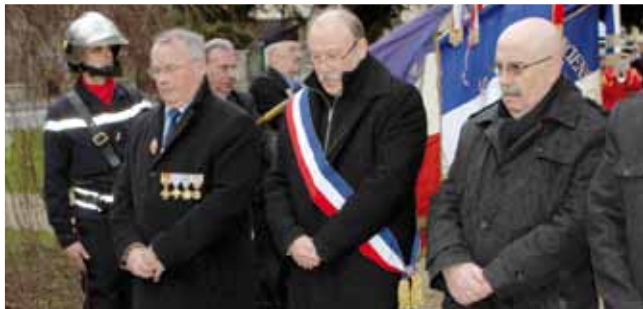
19 mars 51 e anniversaire de la fin de la guerre d'Algérie