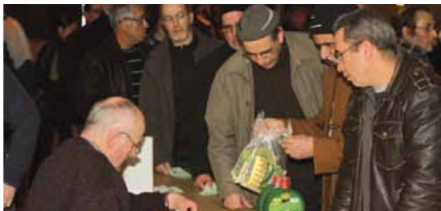
3 février Assemblée générale et distribution des graines par la Société ouvrière d'horticulture et de tempérance de Montataire