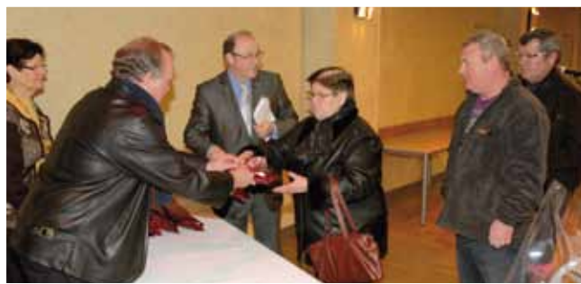
16 février Remise de récompenses aux lauréats du concours des illuminations