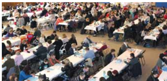
3 mars Loto à la salle Marcel Coene organisé par le Montataire basket-ball