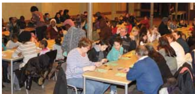
21 février Loto «parents, enfants» à la salle de la Libération organisé par l'Espace Huberte d'Hoker