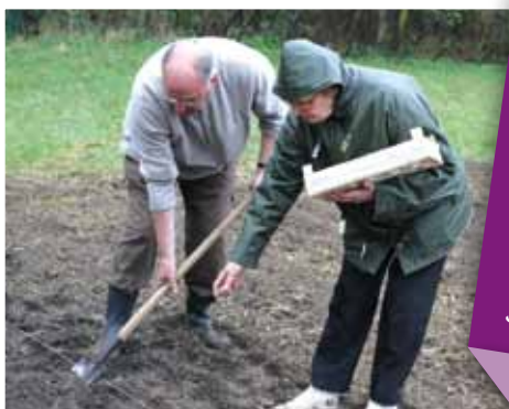
Les jardins partagés

Cette année ce n'est pas moins de trente-deux variétés de légumes, plantes aromatiques et fleurs qui seront plantées par les participants de l'atelier. À terme, les créateurs de cet atelier aimeraient favoriser une prise en charge totale du jardin par les habitants eux-mêmes. ■