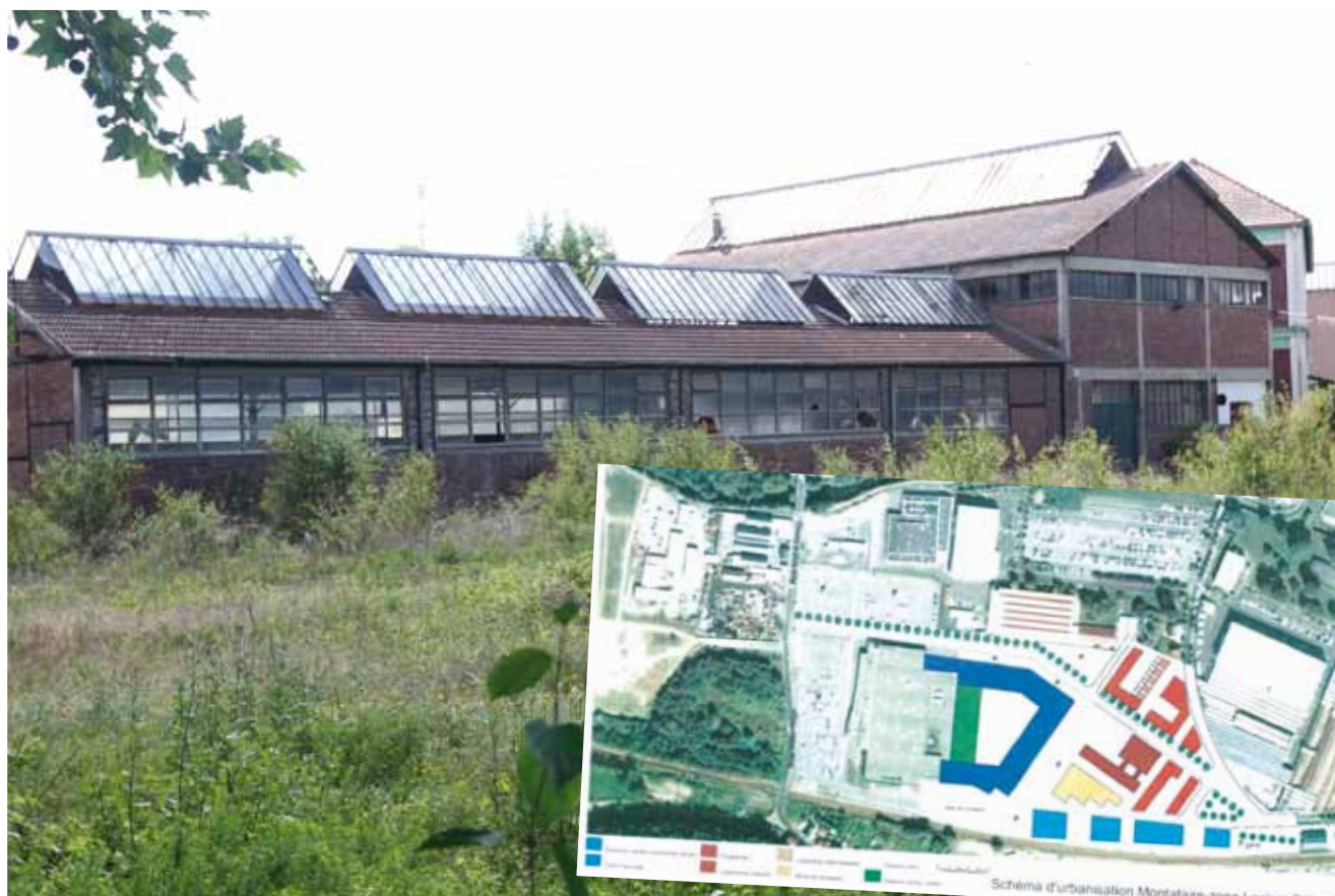
La halle Perret

La nouvelle école de musique fait partie des projets attendus avec impatience. Les locaux actuels sont hébergés dans l'enceinte du groupe scolaire Jean Jaurès et sont bien trop exigus. C'est la halle, construite par l'architecte Auguste Perret en 1919 et réhabilitée en 1949, qui a été retenue pour héberger les activités de l'Amem.