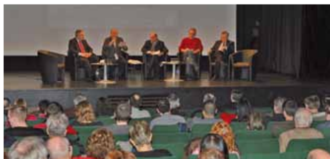
20 mars Forum-débat pour l'avenir de l'emploi industriel