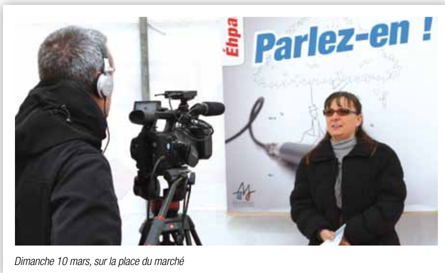
Dimanche 10 mars, sur la place du marché

nouveaux témoignages seront recueillis. Et ensuite ? Ensuite chacun peut contribuer, envoyer son propre témoignage via les réseaux sociaux. Une compilation de l'ensemble des vidéos sera emmenée en main propre, aux responsables de l'Agence Régionale de Santé (responsable pour l'action de l'État) et du Conseil Général (le département). Sauront-ils voir ou ignorer une fois encore ? L'avancement du projet permettra d'en juger... ■