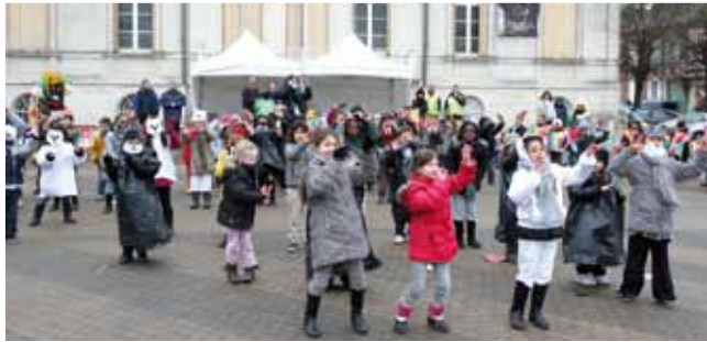
28 février Carnaval de l'accueil de loisirs