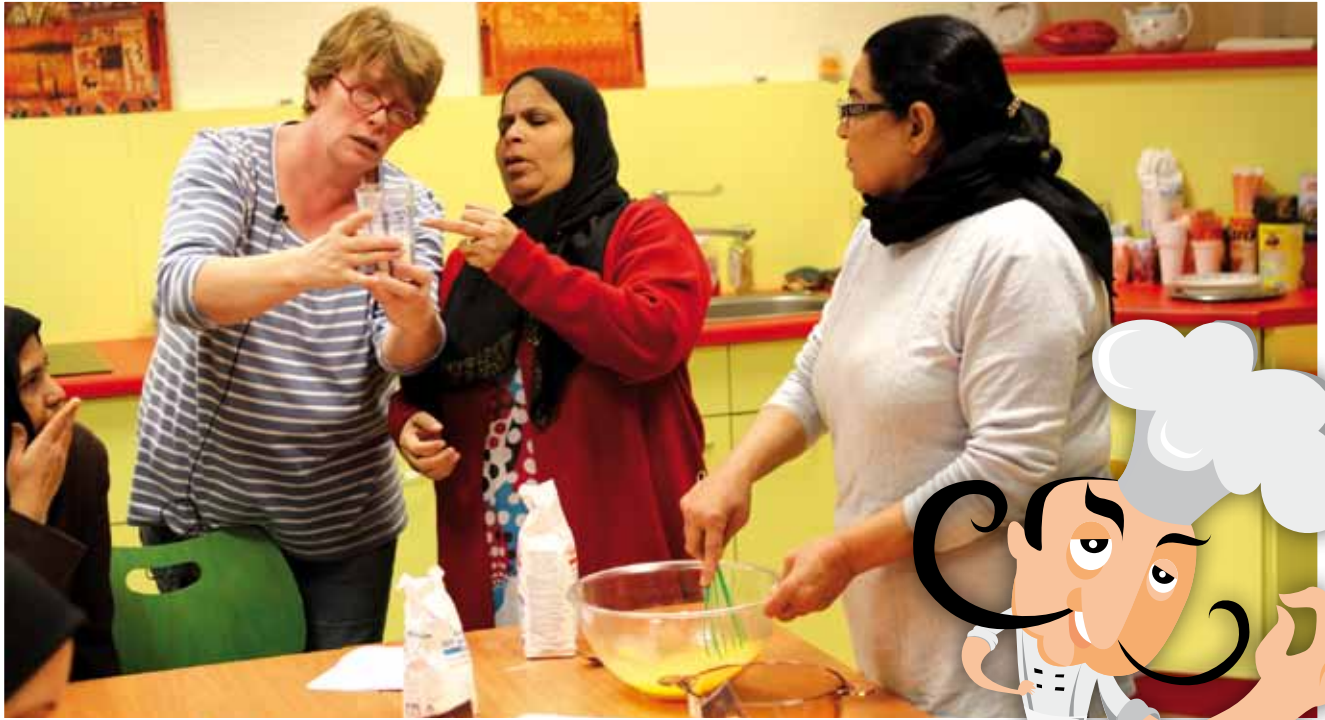
Discussion animée à l'Espace Huberte d'Hoker au sein des ateliers culinaires.

Littéralement, cette expression anglaise désigne un récipient où se mélangent différents ingrédients afin de produire un élément nouveau, comme en cuisine. Détourné par les sociologues, ce concept permettait de caractériser le mélange des cultures présent dans les sociétés modernes.