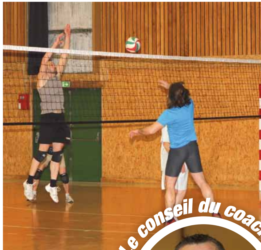
Une ambiance amicale et conviviale

C'est dans une ambiance amicale et conviviale que le club accueille les enfants dès 5 ans, au gymnase Armand Bellard pour des activités de motricités et d'initiation au volley. En partenariat avec la section UNSS (Union nationale du sport scolaire) Volley-ball du collège Anatole France, les équipes de jeunes comptent parmi elles une cinquantaine de licenciés, un succès en partie dû au prix de la licence qui est relativement peu élevé. Le Red Star Montataire Volleyball est conscient de la nécessité de s'adapter pour accueillir au mieux un public de plus en plus large. C'est pourquoi en 2007, cinq personnes ont suivi une formation à la suite de laquelle ils ont obtenu le diplôme DEEV (Diplôme d'Éducateur en École de Volley). D'autres se sont également lancés dans la formation BEES (Brevet d'État d'Éducateur Sportif)