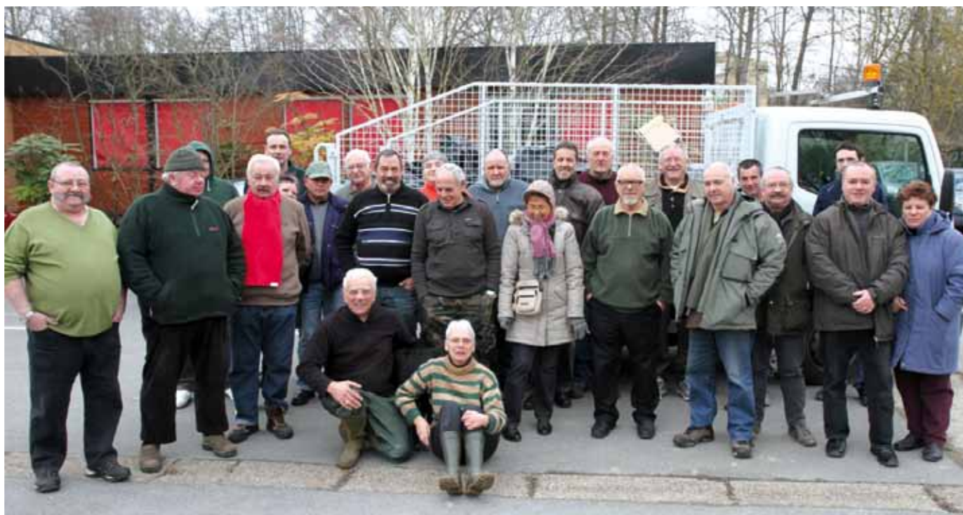
2 mars Bravo aux participants qui ont contribué au nettoyage des Berges du Thérain organisé par les Martins-Pêcheurs