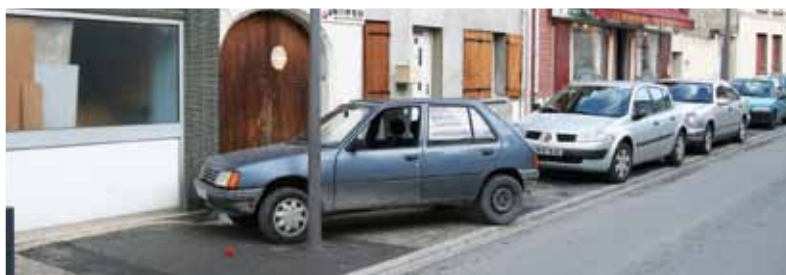
L'un des nombreux stationnement « sauvage » de la rue Jean Jaurès

que seules des règles de vie commune admises de tous étaient garantes du « vivre ensemble ». Qu'il ne fallait pas de « citoyens vigilants », mais « simplement des citoyens solidaires ». Au vu de ces constatations, d'autres réunions seront organisées, peut-être plus fréquentes et moins formelles, pour que le civisme reste une valeur partagée de tous. ■