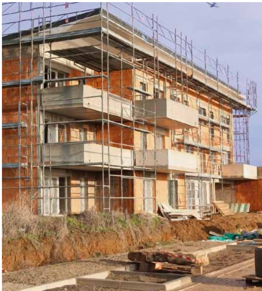
Quartier des Tertres

Le logement, première dépense des ménages, première difficulté rencontrée pour les précaires et les jeunes en recherche d'autonomie, devient une question explosive.