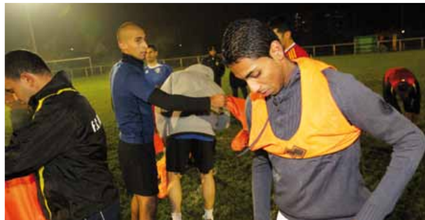
Entraînement du club au stade Kléber Sellier

Au cœur de cette réussite, d'abord le sérieux. A l'entraînement il règne un silence d'église que seul vient déchirer les directives du coach. « Ça joue, ça bosse... qu'est-ce qu'on peut demander de mieux pour un entraînement ». Sérieux sur le terrain, sérieux aussi dans la structure du club. Cette année le FCM s'est vu délivrer les labels national et régional qualité « école de football » aboutissement