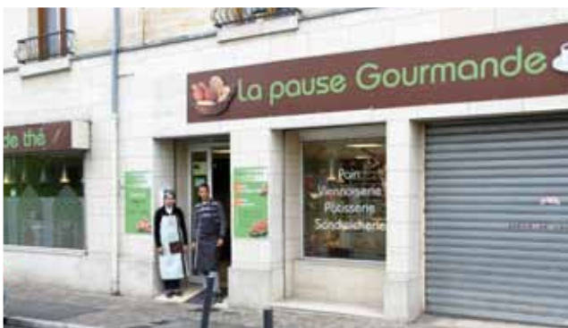
La pause gourmande • Point chaud, restauration rapide, salon de thé 53, rue de la République