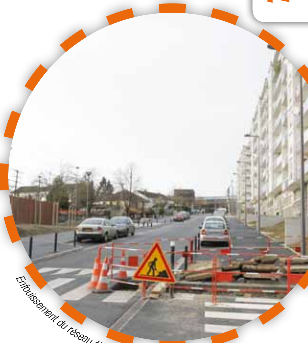
Enfouissement du réseau électrique rue du Colonel Fabien

Les prochaines tranches prévues sont les rues Raymond Coene, rue de Gournay, rue Christian Cognard, rue Jean-Dominique Faure, et la rue Victor Hugo, pour un montant global d'investissement d'environ trois millions d'euros si les conditions financières le permettent. ■