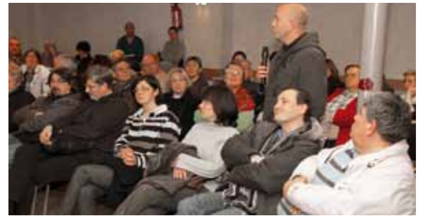
Réunion de quartier à la salle de la Libération

alloués au logement, à l'accueil social, à une démocratie locale renforcée, les habitants se sont exprimés pour faire valoir leurs priorités. Prochain rendez-vous, le vendredi 27 janvier à 18h30 à la salle des fonds de Montataire pour trouver les moyens de renforcer l'emploi et le développement économique. ■