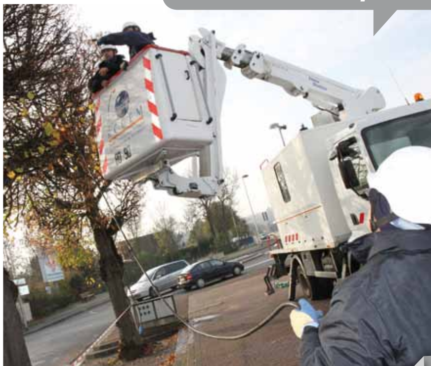
Installation des lumières de Noël par les agents polyvalents

« L'installation des guirlandes c'est le début de la période du froid »