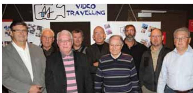
20 novembre Toute l'équipe de « Vidéo travelling » a présenté 20 films de leur réalisation au Palace