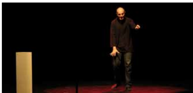
23 novembre « même pas peur » par Ludovic Souliman. Spectacle de contes au Palace organisé par le service lecture publique.