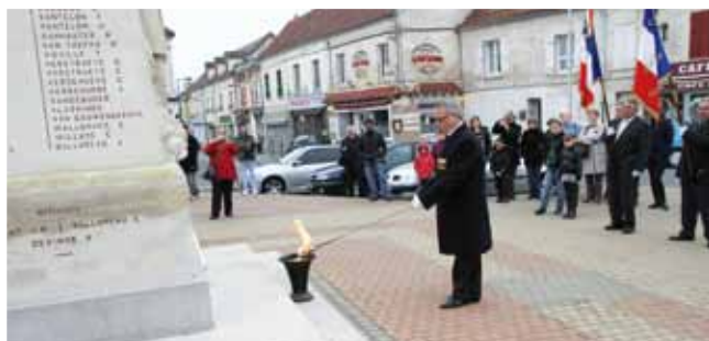
11 novembre cérémonie commémorative de la fin de la 1 re guerre mondiale