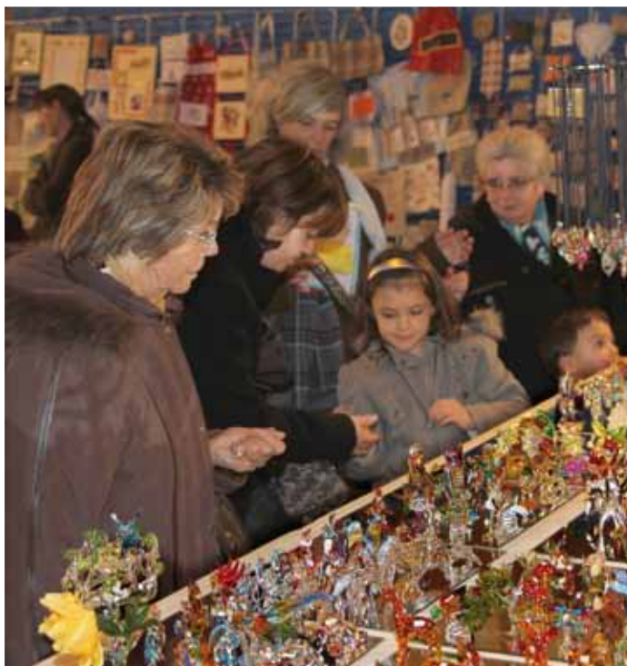
26 novembre Marché de Noël organisé par le « Montataire Basket-Ball » à la salle Ma