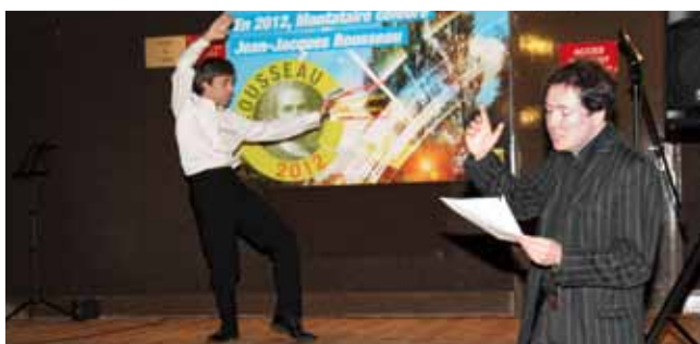
17 novembre La ville de Montataire a lancé les festivités « Rousseau 2012 » au Palace