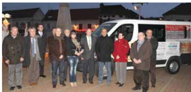
29 novembre Inauguration du véhicule publicitaire municipal avec les annonceurs ayant participé à l'opération.