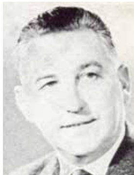
bulletin municipal de 1971 archives municipales 73W9

Iréné Bas est parti. Il avait 90 ans. Difficile d'oublier cet homme dont la capacité d'indignation est restée intacte. Le temps n'avait en rien émoussé son engagement et ses convictions politiques. Il l'avait encore démontré l'année dernière lors de la réunion de quartier consacrée au budget en dénonçant avec toujours autant de force la politique du gouvernement qu'il considérait comme des plus injustes. ■