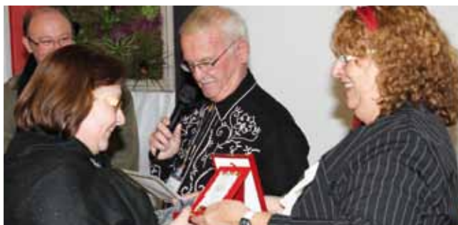
12 novembre 32 e festival des talents cachés de l'association «Formes et couleurs»