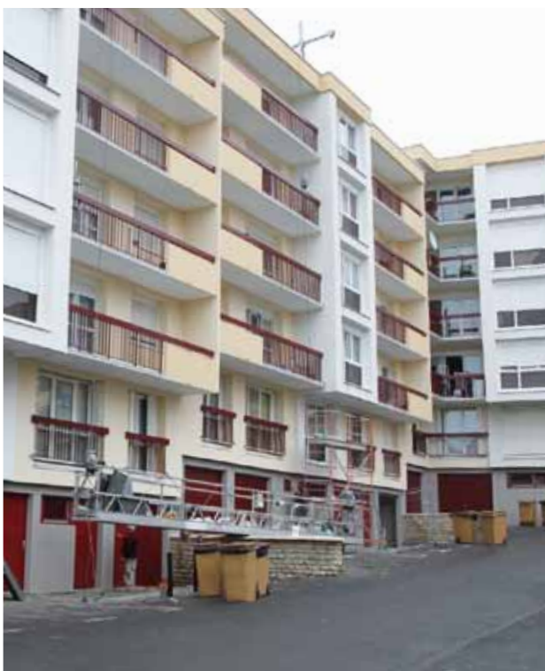
Rue Jacques Decour

Sur le parc social, un important travail de réhabilitation des logements et immeubles à été entrepris aux Martinets. Celui-ci se poursuit avec les ravalements de tous les logements de Oise Habitat sur le quartier (isolation phonique et thermique) sur les deux ans qui viennent. ■