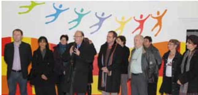
25 novembre Inauguration de la fresque réalisée par la société Akzo Nobel à l'école Maurice et Lucie Bambier.