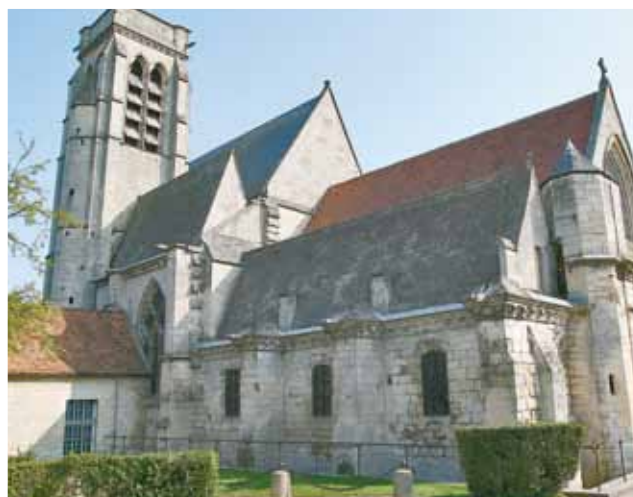
L'Église Notre-Dame de Montataire