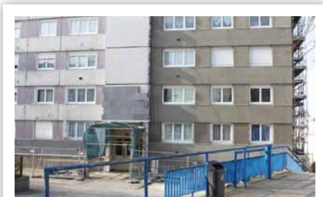
Rue Jacques Decour

social, d'augmenter les loyers mais c'est impossible au regard des ressources des locataires ». Pourtant, ces programmes sont