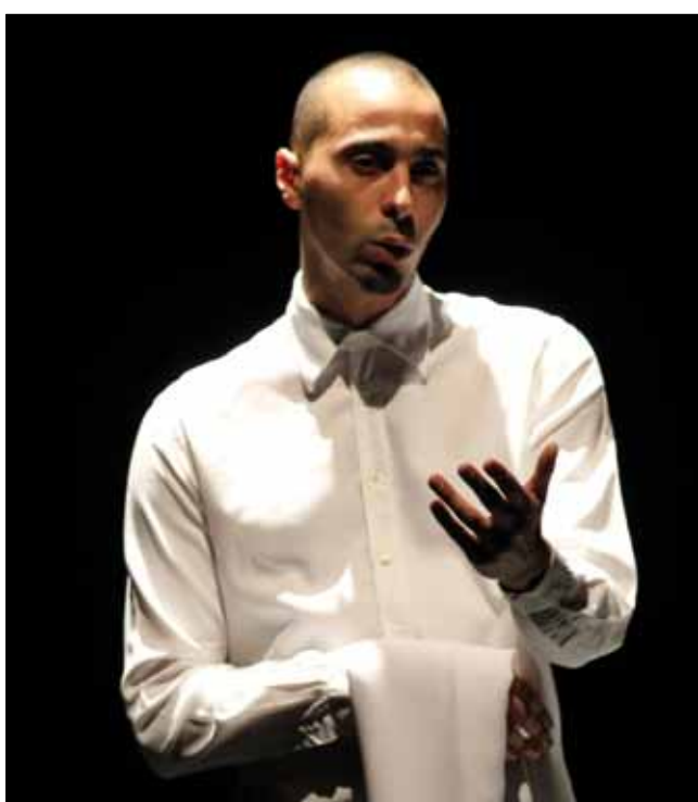
25 novembre La pièce de théâtre « sans ailes et sans racines », l'histoire de tous les exilés, au Palace