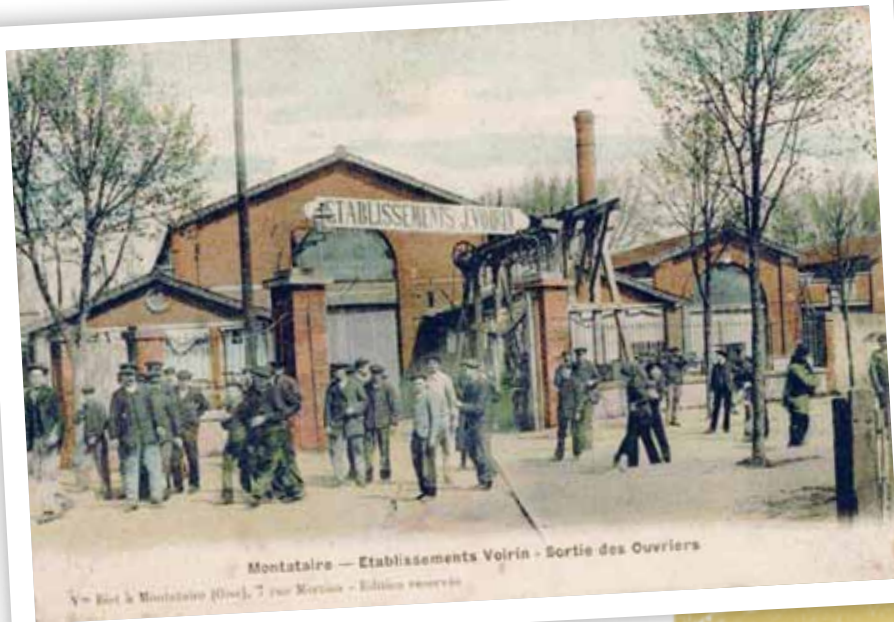
Sortie des ateliers Voirin de Montataire, début du 20 e siècle Références archives municipales : 1ph77

En 1905, dans « Le Travailleur de l'Oise », il dit : « Allons camarades ouvriers, n'avez-vous pas encore assez sué et peiné au profit du capital ? Ne vous êtes-vous pas encore assez courbés devant les exploités ? N'êtes-vous pas encore convaincus que l'émancipation des travailleurs ne peut être que l'œuvre des travailleurs eux-mêmes ? Si oui, apprenez à vous connaître. Rentrez dans les syndicats qui sont les foyers de l'éducation ouvrière ». ■